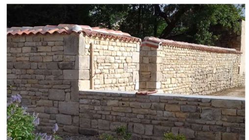
Mur en moellons